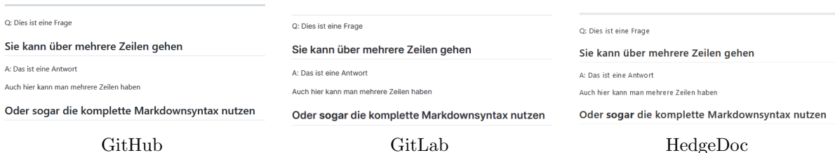
Abbildung 4: Rendering der in Abb. 3 definierten Syntax

Zuletzt ist das visuelle Rendering sehr unintuitiv, insbesondere da ohne freie Zeile die horizontale Linie in eine Überschrift umgewandelt wird